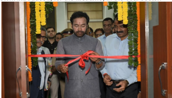
Union Coal and Mines Minister G Kishan Reddy.

Speaking at the Central Coalfields Limited (CCL) headquarters in Ranchi, Union Coal and Mines Minister G Kishan Reddy inaugurated the Integrated Command and Control Centre (ICCC), a new system introduced, for the first time, in the coal sector.