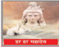
हर हर महादेव

● वर्ष 06 ● अंक 169 ● वागणसी ● बुधवार, 17 सितम्बर, 2025