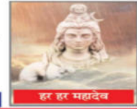
हर हर महादेव